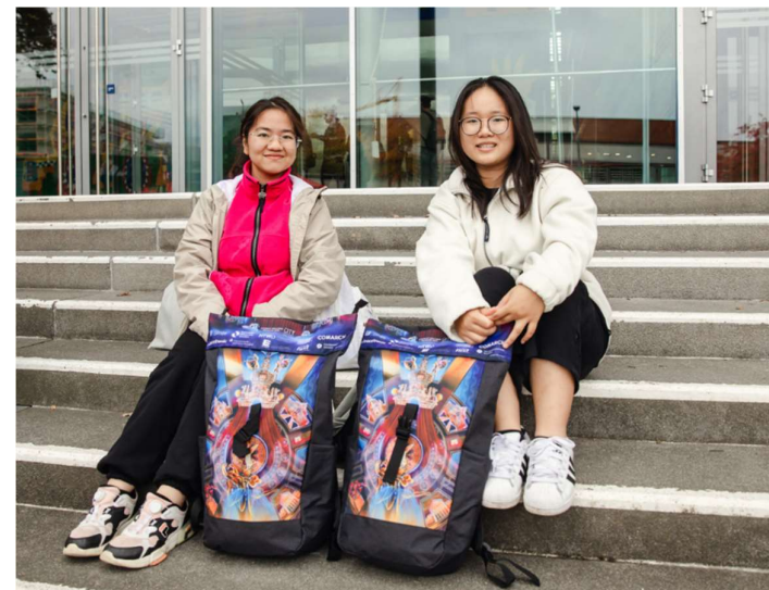
Hauptausgabe 2025 | Hörsaalzentrum der TU-Dresden